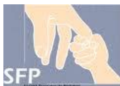
Pr Dominique Turck