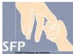
Pr Dominique Turck